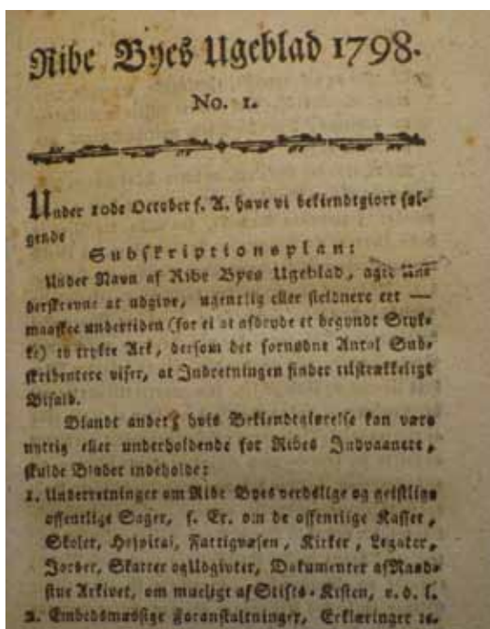
Fig. 3. I 1798-99 udgav borgmesteren og stiftsprovsten et lille tidsskrift, der blev brugt til at orientere lokalbefolkningen om vigtige kommunale anliggender. "Ribe Byes Ugeblad" kom dog kun til at handle om to emner, men de fik til gengæld en ganske fyldig behandling. Det var fattigvæsenet og bylandbruget. Tidsskriftet indeholder afskrifter af flere af de vigtigste dokumenter om fattigvæsenet i årene fra og med 1789. Det kgl. Bibliotek.

In 1798-99 the Lord Mayor and Dean of the diocese published a small magazine, which was used as a platform to orientate the local population about important municipal matters. As it turned out "Ribes Byes Ugeblad" only came to deal with two subjects, but these were then given ample coverage. The main subjects were the poor system and the towns farming community from 1789 onwards.